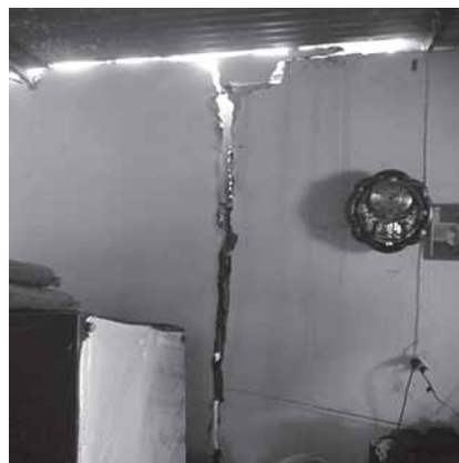
Fig. 5.- Agrietamiento en casas en el Sector de San Miguel.

Estructuralmente no se observan rasgos importantes debido al origen reciente