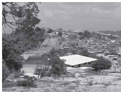
Fig. 2.- Derrumbes derivados de la fuerte intervención antrópica.

En general se puede decir, que el área dominada por esta unidad posee un potencial erosivo medio a alto en equilibrio precario, sometido a movimientos de masa localizados y erosión laminar, además con morfogénesis activada por intervención antrópica generalizada hacia las zonas de vertientes y fondos de valle. Como resultado de esto se ha producido en los últimos años el colapso de no menos de 80 viviendas en el sector La Floresta por alta concentración de aguas saturando el material ya descrito