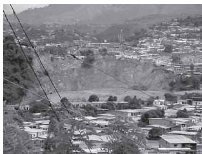
Fig. 4.- Colapso de taludes por socavación del nivel de base.

Se presentan como zonas aisladas a lo largo de los cursos del Motatán y Momboy, la zona de mayor área sirve de