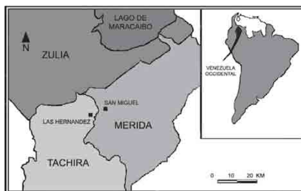
Fig. 1.- Mapa de ubicación de la zona de estudio.

La Luna suele asociarse principalmente a las características de dicha cuenca. Esta presentó un paleorelieve irregular (con barreras paleogeográficas) que originó diferentes zonas con distinta circulación, poco intercambio de aguas entre sí y diferente aporte sedimentario. Por tanto, se establecieron zonas de mayor profundidad (surcos) con características