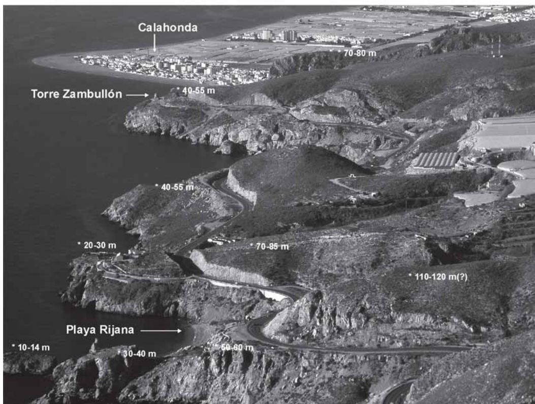
Fig. 2.- Foto superior: Vista del perfil del SE de Cerro Gordo desde la localidad de La Herradura. Se observa bien la forma de rasa y el paleoacantilado. Foto inferior: Vista oblicua desde avioneta a baja altura del sector de la playa Rijana a Calahonda. Se indican con un asterisco y la altura varias de las formas de abrasión marina.

Fig. 2.- Upper photo: profile view of the SE of Cerro Gordo from the locality of La Herradura. The terrace and cliff forms are well expressed. Lower photo: oblique view from a light aircraft flying at low height showing from the Rijana beach to Calahonda town. Several marine abrasional forms are indicated with an asterisk and the height.