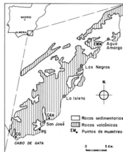
Fig. 1.- Esquema de situación de las muestras de rocas volcánicas silicificadas. EM = Cala de Enmedio, CAH = Cala Higuera, CG = Cabo de Gata, PG = Playa de Los Genoveses.

Estas rocas se presentan en yacimientos de estructuras variadas, en forma de bre-