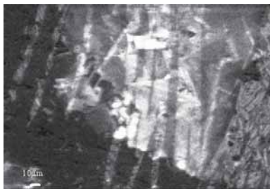
Fig. 4 Imagen en CL-MEB de bandas de fuerte emisión en un cristal de cuarzo y que se asemejan a las maclas de una plagioclasa. Muestra PG-6.