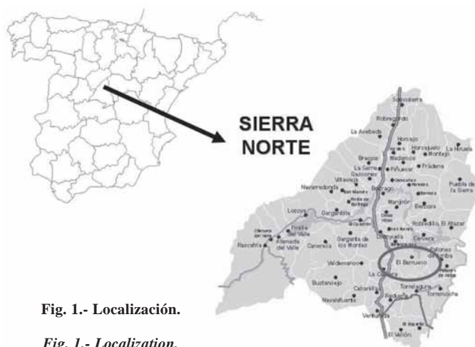
Fig. 1.- Localización.

Desde el punto de vista de la vegetación y de acuerdo a las características de zonificación biogeográfica utilizada por Peinado y Rivas (1987), la zona de estudio se encuentra enmarcada en el reino Holártico, distrito Guadarramense y piso