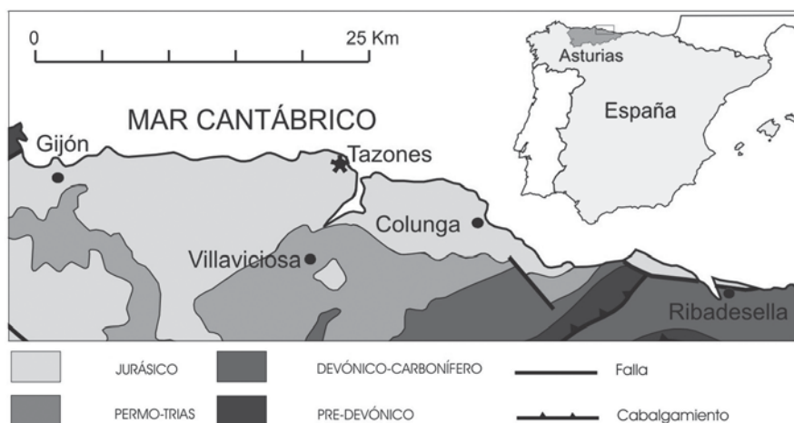
Fig. 1.- Situación geográfica y geológica del yacimiento.

De Phyllodon únicamente se conocen fragmentos de dentario y dientes aislados