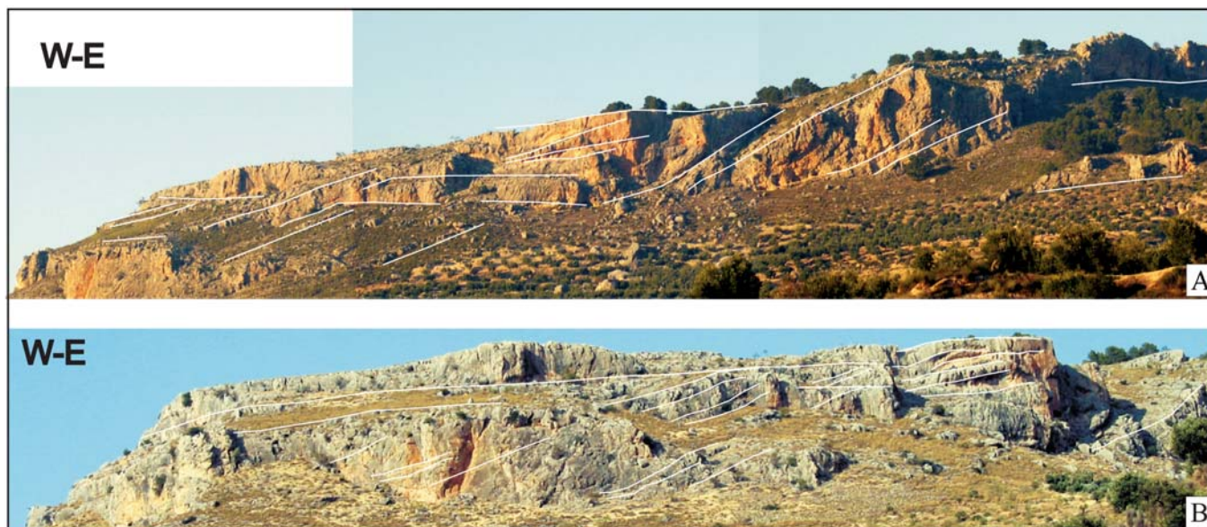
Fig. 2.- A. Panorámica parcial de los afloramientos de la Serrezuela de Pegalajar. Las líneas blancas indican superficies de estratificación. B. Detalle del extremo occidental del afloramiento de la figura 2A.