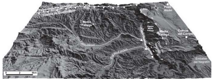
Fig. 2.- Esquema sobre el modelo digital del terreno en el que se muestra la paleo-red de drenaje en el sector de la captura de la cuenca.

Actualmente no existe un consenso sobre la edad de la captura y son varios los criterios utilizados por distintos autores. La mayoría estima que la superficie de glacis es un buen marcador para calcular la edad. El problema radica, por tanto, en la datación de esta superficie, ya que al no tratarse de un nivel litológico, sino de una superficie geomorfológica, requiere de niveles litológicos asociados y coetáneos con ella, y los seleccionados has-