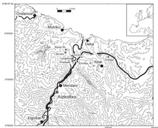
Fig. 1.- Localización del yacimiento de Aizkoltxo.

Fig. 1.- Geographic location of Aizkoltxo site.